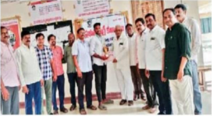
విద్యార్థిని అభినందిస్తున్న ప్రిన్సిపాల్, ఉపాధ్యాయ సిబ్బంది