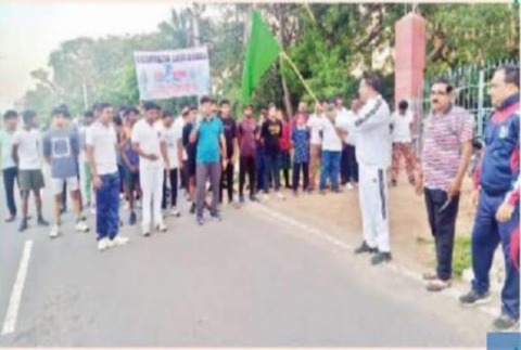
3కే రన్ పోలీసులు, విద్యార్థులు

యువతలో శక్తిని బాధ్యతను నింపుతుంది - యువతను ప్రోత్సహించేందుకే 3కే రన్